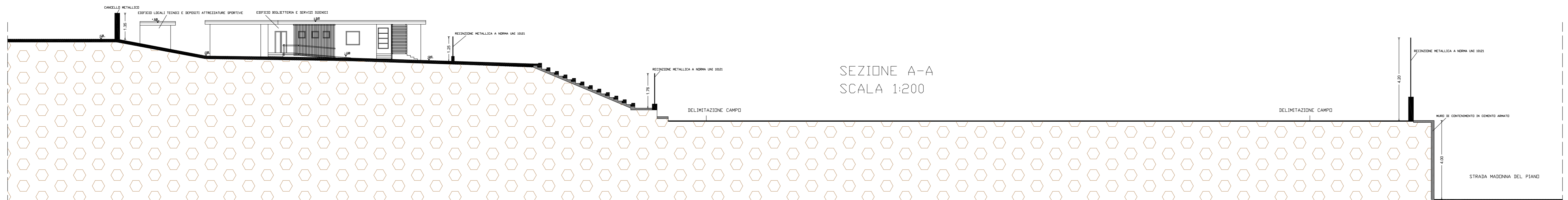
SEZIONE A-A SCALA 1:200